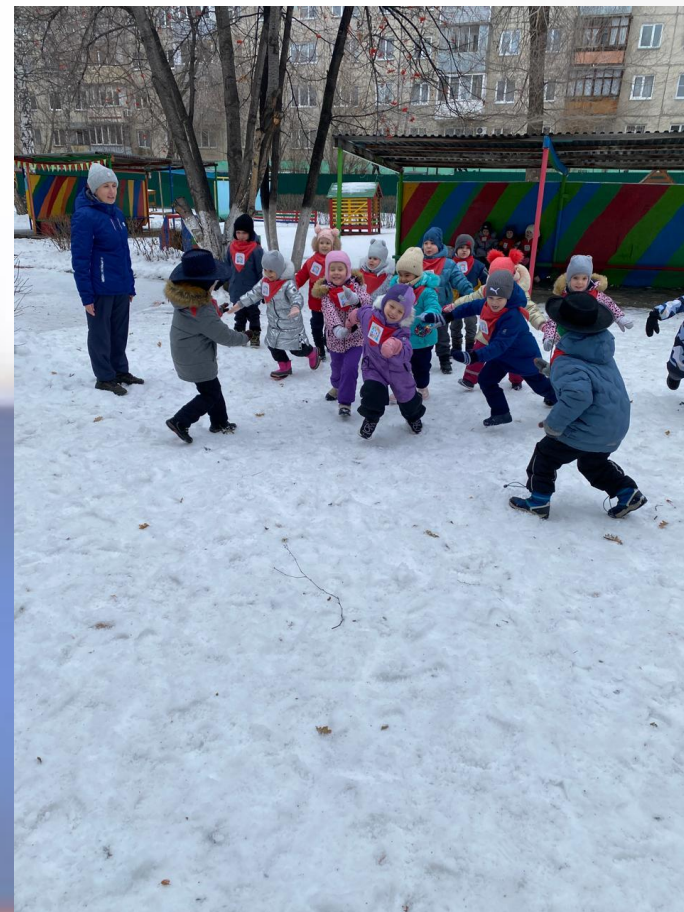
Подвижная игра «Охотники и соколы»