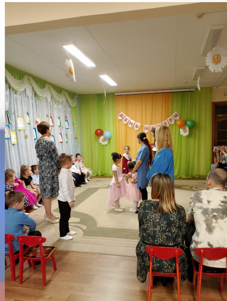
Игра «Скажи ласковое слово»