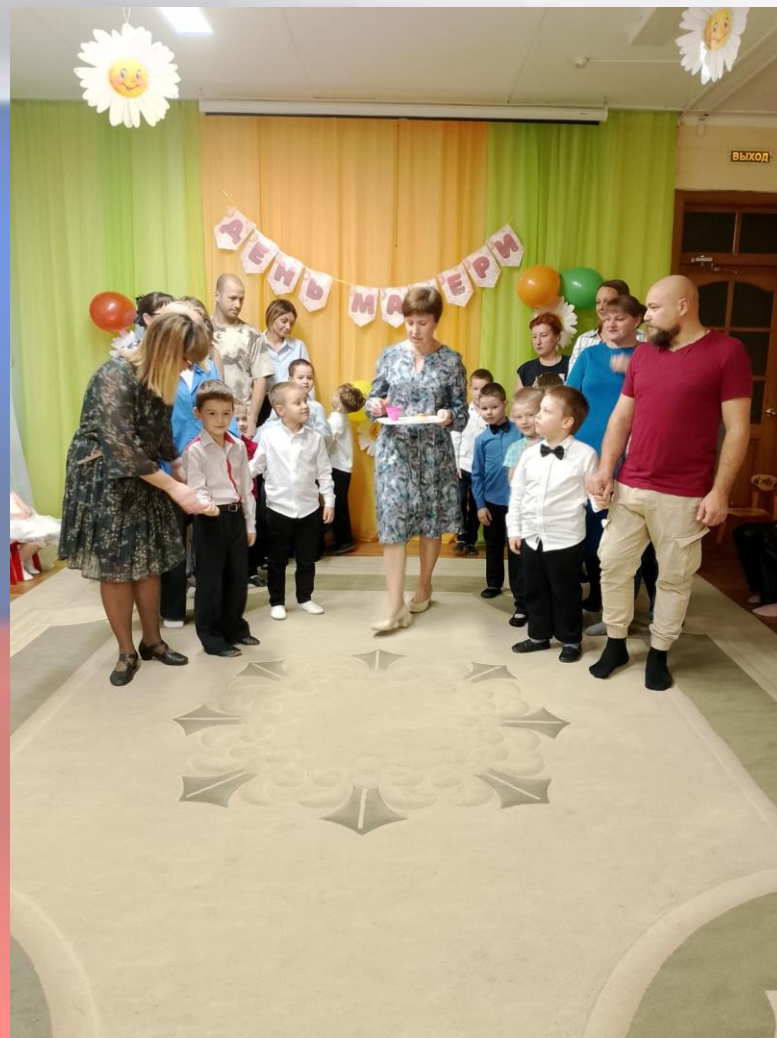
Играем вместе с мамой