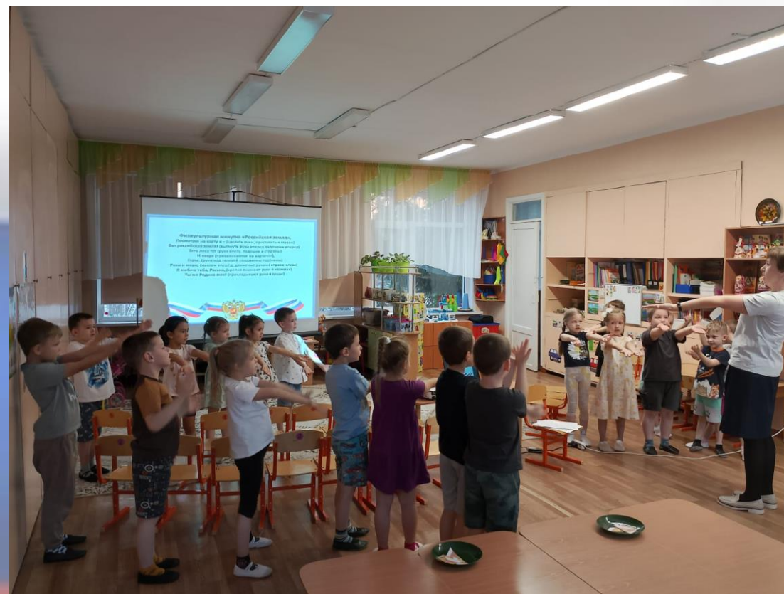
Открытое занятие «Большая и малая Родина»